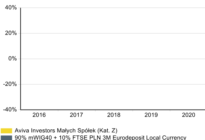
Wykres: 1-roczne stopy zwrotu subfunduszu i benchmarku